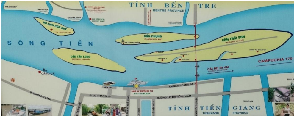
Hình 2. Sơ đồ du lịch của Thành phố Mỹ Tho

phong cảnh, khu phong cảnh, khách sạn, nhà hàng, nơi vui chơi giải trí ở điểm du lịch đa phần trên sông nước thì vai trò của giao thông vận tải thuyền ghe trong phát triển du lịch là thực sự cần thiết (Hình 2). Như vậy để đến được các điểm du lịch trên bộ của tỉnh như chùa Vĩnh Tràng, trại rấn Đồng Tâm, ... thì du khách có thể sử dụng hình thức vận chuyển bằng đường bộ. Tuy nhiên, nếu đến trạm Mỹ Tho, là cửa ngõ đầu tiên của tuyến du lịch đến Đồng bằng Sông Cửu Long, khách du lịch buộc phải chuyển đổi sang hình thức vận chuyển bằng thuyền ghe để đến những điểm đến khác trên sông nước, nhỏ và chi tiết hơn.