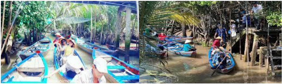
Hình 3. Cảnh bến tàu lên xuống khi thủy triều và ngày cao điểm

du lịch trong và ngoài nước. Theo thống kê của Sở Văn hóa, Thể thao và Du lịch Tiền Giang, tổng lượng khách đến địa phương năm 2023 đạt 1,4 triệu lượt, trong đó, có gần 470.000 khách quốc tế, đạt tổng doanh thu khoảng 1.000 tỷ đồng. Để đạt được mục tiêu biến du lịch thành một ngành mũi nhọn, chính quyền thành phố đã vận động nhân dân tự giác và tích cực tham gia giữ gìn an ninh trật tự, cảnh quan môi trường thiên nhiên, môi trường du lịch, nâng cao chất lượng các dịch vụ du lịch; thực hiện nếp sống văn minh, xây dựng hình ảnh du lịch Mỹ Tho và ưu tiên nguồn lực, tăng cường đầu tư kết cấu hạ tầng; bảo tồn, tôn tạo, phát huy các giá trị bản sắc văn hóa, giá trị của tài nguyên du lịch. Một trong những giải pháp quan trọng là tập trung khai thác các tiềm năng, thế mạnh để phát triển du lịch.